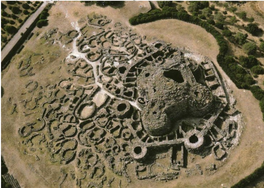
Complexe nuragique de Barumini, Sardaigne

Prolongement pour les élèves de la 11 e et 12 e année à faire après l'activité « Je vois, je pense, je m'interroge » : les élèves lisent suivant. Au cours de cette discussion, les élèves partagent leurs interrogations et réfléchissent à la mesure dans laquelle le texte a répondu à celles-ci. https://www.histoire-et-civilisations.com/thematiques/prehistoires/les-nuraghes-socles-de-la-sardaigne-antique-60829.php